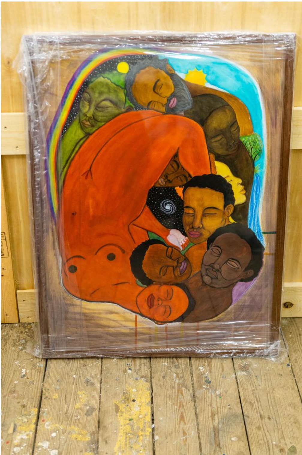
Kyp Malone'i maal «Esivanemate uni».