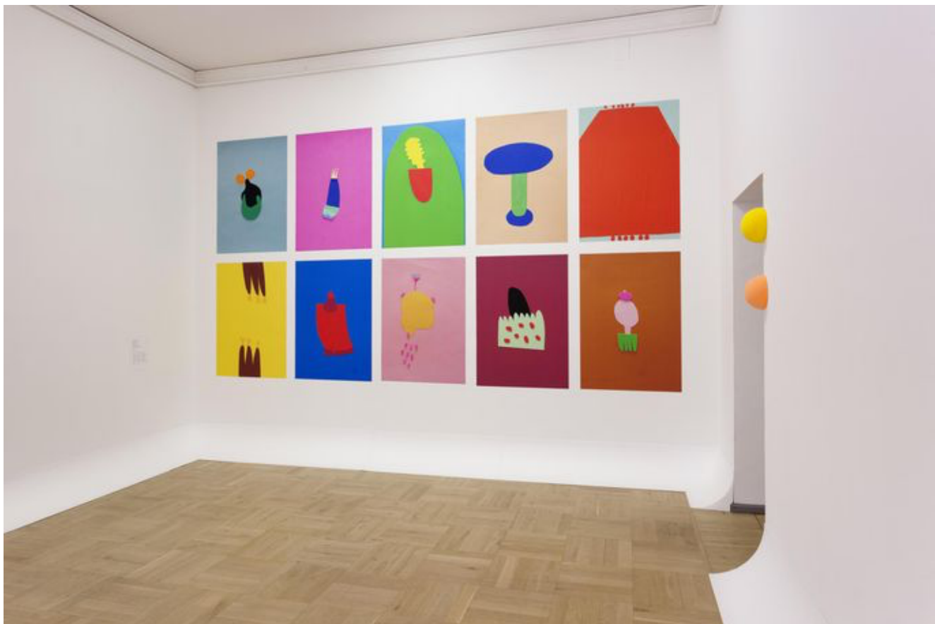
«Elust välja lõigatud». Kollaažid, tinditrükk paberil.

«kui lähedal võib lähisuhtevägivald toimuda».