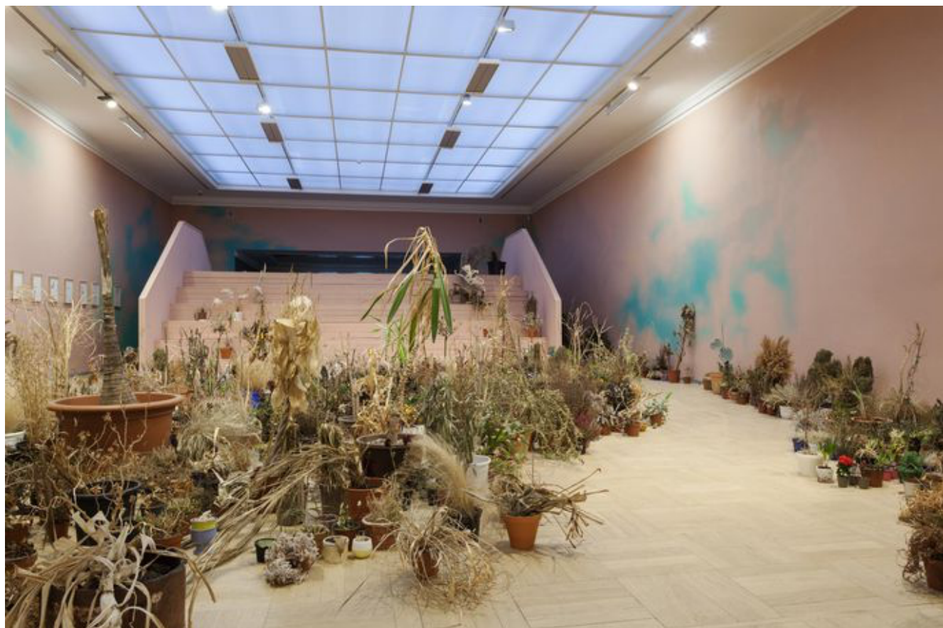
Installatsioon «Vägivald kasvab vaikus».

Niisiis on igasuguse sotsiaalse kunstipraktika eelduseks selle dialoogilisus ja empaatia, lähtumine mõnest avalikust, ühiskondlikust ja sotsiaalsest probleemist. Siin ei kõnelda monoloogiliselt autoripositsioonilt, mis püüdleb, ütleme, kunstniku sisemise tunnetuse universaalse väljenduse poole, et tekitada publikus mingi äratundmine.