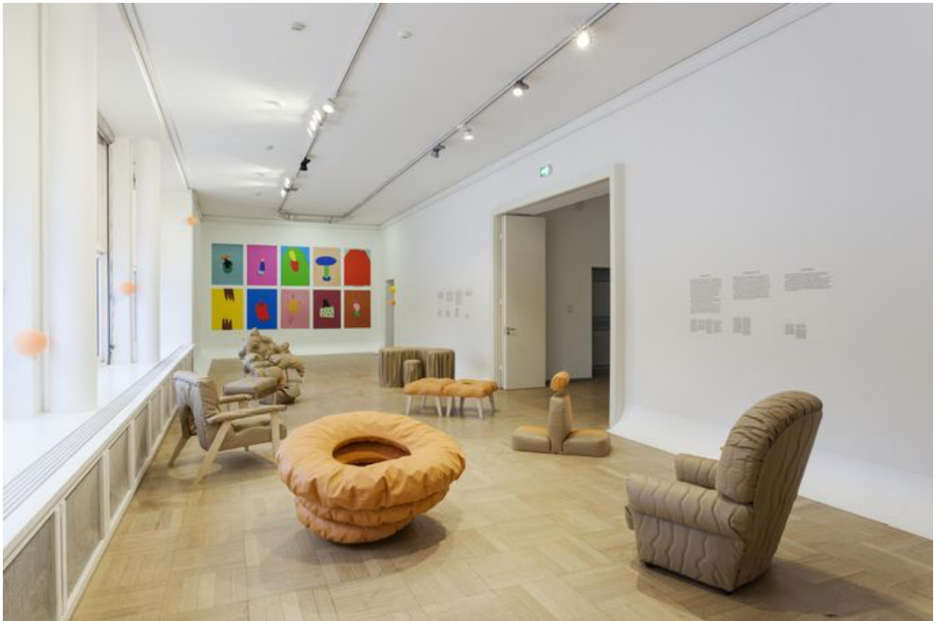
Flo Kasearu näitus «Elust välja lõigatud». Näitusevaade.

oli eelkõige suunatud grupi liikmetele endile, et saada üle traumaatilisest kogemusest ning leida viis, kuidas oma kogemust jagada. Kasearu oli siin kogemuse vahendaja ja lavastaja rollis, leides nii isiklikele traumale kui ka laialt levinud sotsiaalsele probleemile kunstilise väljundi disainides ja raamides seda, kuidas ja mil viisil teema avalikkuse ette jõudis.