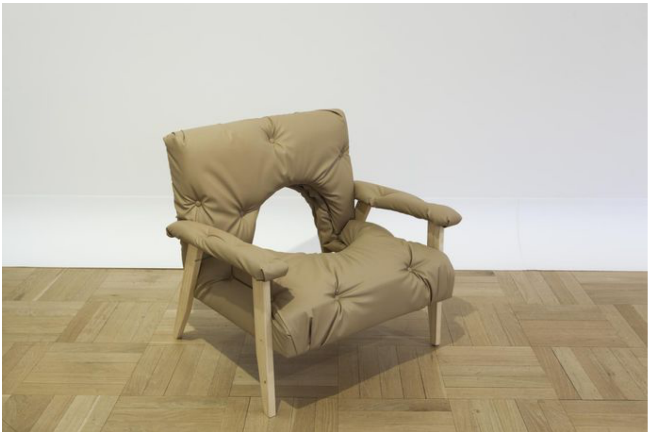
Suure auguga tool installatsioonist «AHHaa grupp».

metafoore on näitusel õigupoolest vaid kaks. Suure saali installatsioon «Vägivald kasvab vaikus» (2021) koosneb tervest saalitäiest kuivanud toataimedest ning osutab näituse kuraatori Cathrin Mayeri tõlgenduses «kasvu pidurdumisele pideva väärkohtlemise tagajärjel». Pika aja jooksul kogutud taimed on kas vaevu elus või juba päris kuivanud – see on suurepärase kujund kiduvatele inimsuhetele.