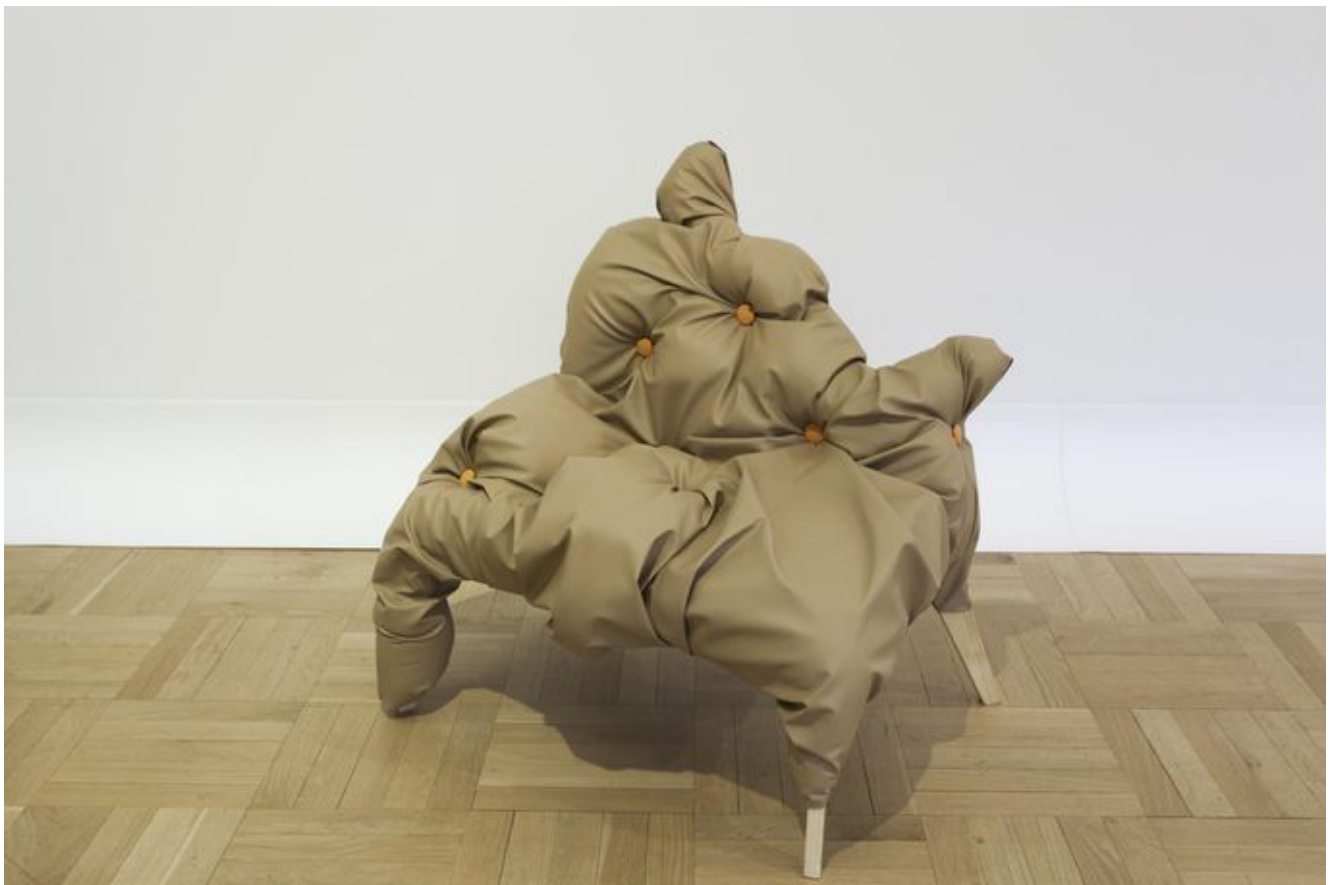
Põõsastool installatsioonist «AHHaa grupp».

Kahtlemata on siin tegemist teatud tüüpi tõsielukunstiga, kuid sellisega, mis kasutab väljendusvahendina hoopis rohkem klassikalisi kunstivahendeid kui fotot ja videot, mis on enam levinud meediumid kunstnike arsenalis, kes sedasorti motiive käsitlevad.