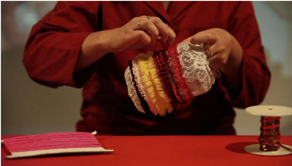
„Creative Estonia“ (2012).

Naked Island on mingis mõttes meie vastus loomemajandusele. Üldiselt on nii, et kunstnikud üürivad kusagil vanas hoones ajutiselt ateljeed ning kui maksujõulisemad kliendid saabuavad, peavad kunstnikud lahkuma. Meie panime neljakesi oma oskused, initsiatiivi, aja, isiklikud ja perekondlikud finantsid ja kogemused kokku, moodustasime OÜ, et luua varametes hoonesse normaalsete tänapäevaste töötingimustega tööpindade kompleks. Soov oma töötingimusi parandada on niivõrd suur ning kuna panustame sinna väga palju aega ja ressursse, soovime teha need võimalused ka teistele kättesaadavaks. Me tegutseme selle nimel, et mitte olla see loomemajanduse esimene kiht, kelle peal hiljem muu maailm üritab sõita.