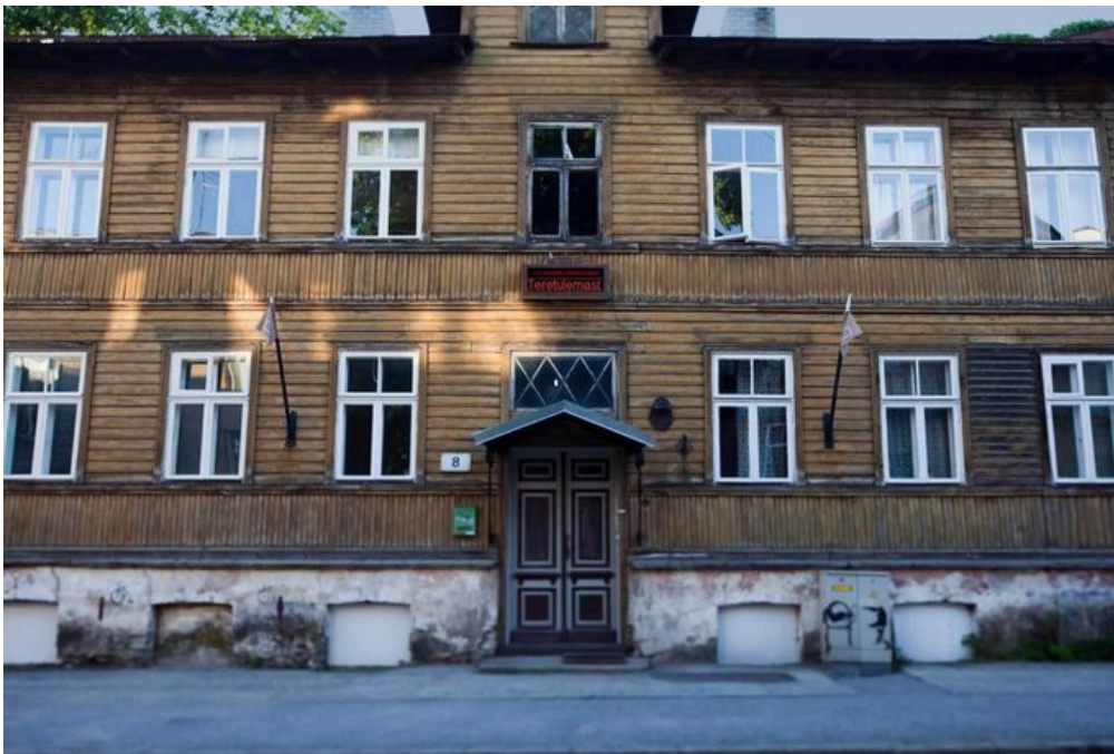
Flo Kasearu majamuseum Pelgulinna.