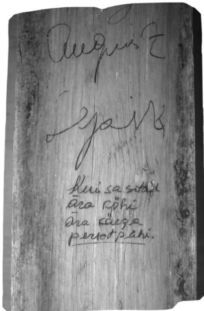
Infrapunafoto kirjutisest Kodavere välikäimla seinäl.

kogudes» raames Juhan Liivi muuseumis residentuuris viibides käimla tähendust kohalikele Kodavere elanikele. Valmis mahukas kunstiprojekt, mis koosnes tualettruumi restaureeritud seintest ja sealseste sõnumite uurimisest. Seda on näidatud 2018. aastal Liivi muuseumis projekti «Kunstnikud kogudes» raames ja Roomas Nommas Foundationis.