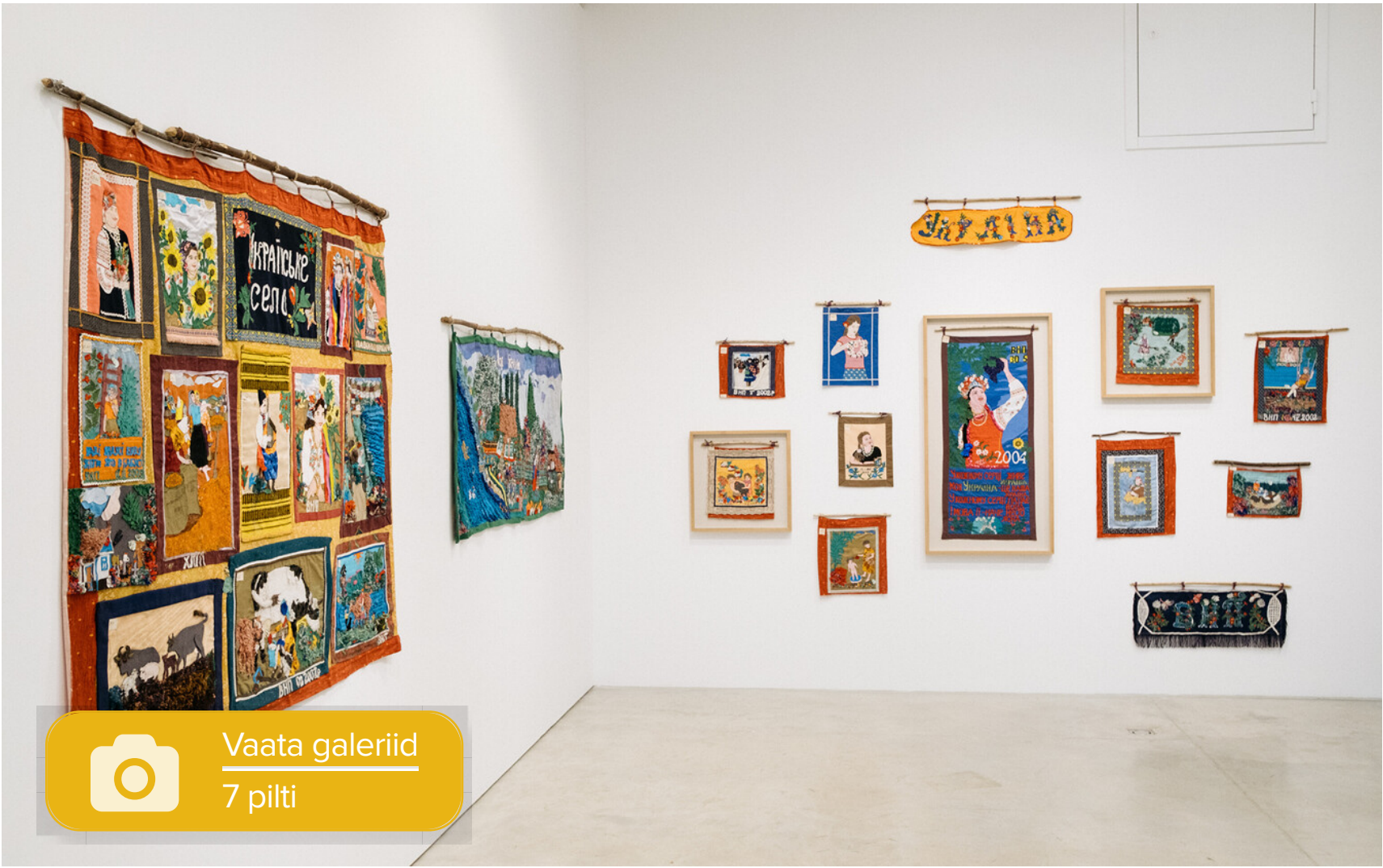
Foto: Nina Vynnyk Temnikova ja Kasela galeriis Autor/allikas: Priit Mürk/ERR