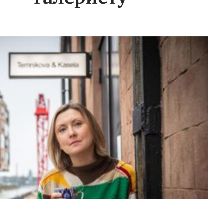
своей галереи в Таллинне.

Насамом деле, первые два шага уже внесли довольно много ясности – теперь было известно, кто, откуда, почему и как. Вишенкой на торге стала бы беседа с самой художницей, но, как уже упоминалось, она умерла в 2011 году, а ее наследие хранилось в Украинском культурном центре.